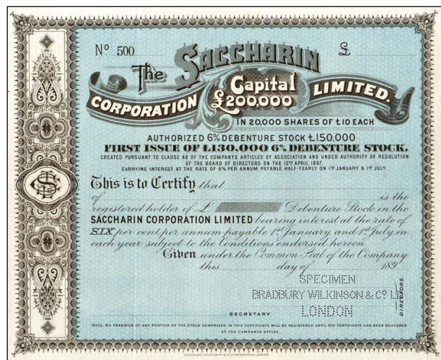
E6761 - Akcie The Sacharin Corporation, blanket z roku 1897