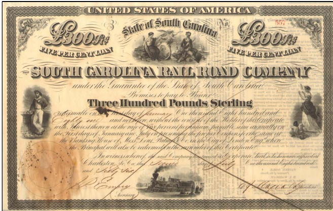
Y3106 – Dluhopis South Carolina Railroad z roku 1862 na 300 GBP

Další novinkou je akcie firmy Julius Meindl AG ve Vídni. O firmě netřeba mnoho říkat, rozsáhlý článek ve věstníku č. 4/2016 o ní obšírně referuje. Konečně se nám podařilo získat poválečnou emisi rakouské matky. Jak je vidět, stále dominuje motiv kávových listů a námořní plachetnice, která byla symbolem firmy, přestože pro obchody byl typický černoušek. Zkrátka firma a obchod jsou dvě různé věci.