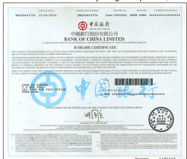
G3539 – akcie Bank of China Limited vydaná v Hong Kongu

Počítačové akcie, ale nejsou doménou jen posledních několika let. Důkazem je poslední dnešní novinka. Vytištěna byla v březnu 1965, opět londýnskou tiskárnou Bradbury, Wilkinson. Není nijak krásná, ale důležitý je papír. Jak je vidět, má pomocnou perforaci, kterou nazýváme traktor a tedy slouží pro tisk do tiskáren u počítače a to jak si počítáte už před 52 roky. V době, kdy byly počítače velikosti malého bytu a jejich paměť byla srovnatelná v dnešní době s chytrým telefonem. Zkrátka pokrok je všude.