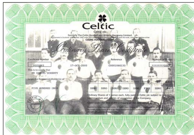
G3537 - Akcie Celtic plc na 500 ks po 1 pencí, vydaná 17.10.2000

Akcie firmy Sacharin byla označena jako tzv. domácí akcie britského typu. Tiskárna Bradbury, Wilkinson & Co. a mnohé jiné, tiskly ceniny jak pro místní tak pro zahraniční emise. Obchodovalo se s nimi na burzách po celém světě a tak vyžadovaly lepší tiskovou ochranu. Zpravidla mají ocelotisk a jsou více barevné jako akcie firmy SACOR, tedy Sociedade