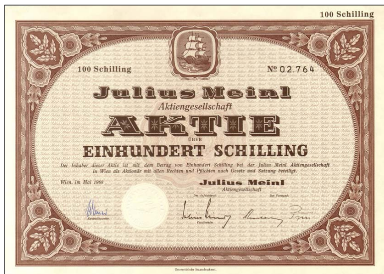
G3538 - Akcie firmy Julius Meinel AG na 100 ATS, vydaná v květnu 1968 ve Vídni