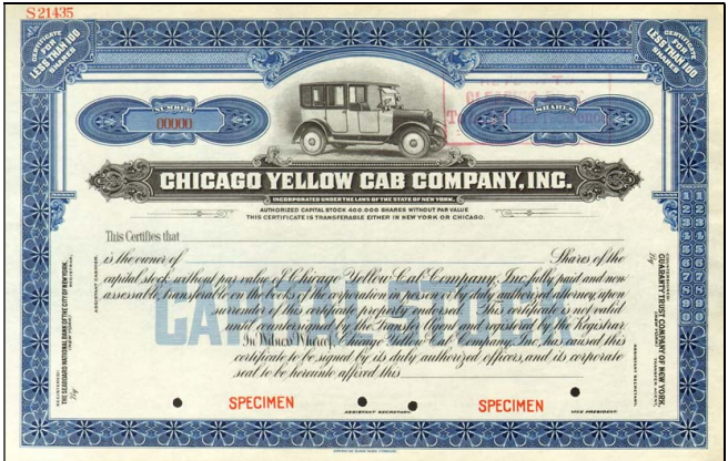
Y3107 – vzor akcie Chicago Yellow Cab Company z roku 1925

Další zajímavostí je dluhopis dráhy South Carolina Railroad Company vydaný s garancí státu Jižní Karolína 2. července 1866. Nutno ještě zdůraznit, že zajímavostí není jen státní garance soukromé firmě, která měla vybudovat železnici, ale hlavně to, že emise není v dolarech, ale v librách šterlinků. Měně, bývalé koloniální mocnosti. Jižní Karolína byla anglickou provincií, která jako první podepsala listinu třinácti zakládajících států USA v roce 1776. Jenže byla také prvním státem, který se od Unie odtrhnul a to 20. prosince 1860 o rok později se stala členem Konfederace. Zpět k unii se připojila až v roce 1868. Přestože Konfederované státy americké nebyly uznány žádnou evropskou mocností, Velká Británie měla zájem na pomoci, protože zde měla své obchodní zájmy související s produkcí bavlny. Emise vydaná v librách je tedy logickou snahou o podporu státu bojujícího v občanské válce.